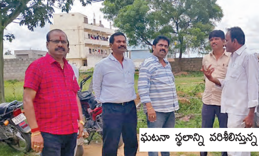
ఘటనా స్థలాన్ని పరిశీలిస్తున్న టీడబ్ల్యుజేఎఫ్ నాయకులు