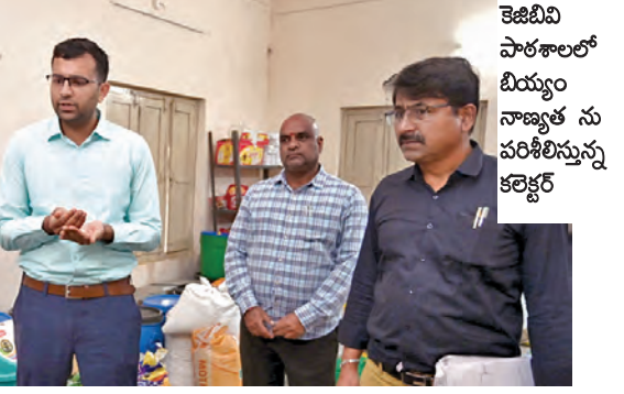
కెజిబివి పాఠశాలలో బియ్యం నాణ్యతను పరిశీలిస్తున్న కలెక్టర్